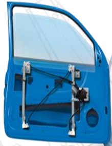
СКЛОПІДЙОМНИК З ПОДВІЙНОЮ ДУГОЮ