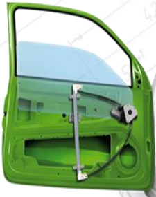
СКЛОПІДЙОМНИК З ОДИНАРНОЮ ДУГОЮ