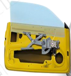
СКЛОПІДЙОМНИК З СИСТЕМОЮ ВАЖЕЛІВ «НОЖИЦЯМИ»