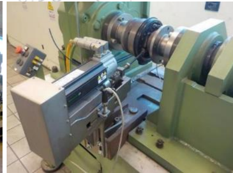
Beispiele: Ermüdungstest auf Mechanikprüfstand