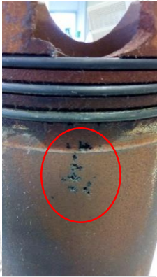
Lochfraß an den Kolben durch Kavitation des Kühlmittels.

Mit dem Schaumtest lässt sich bestimmen, ob das Kühlmittel Kavitation im Kreislauf erzeugt. Bei einem guten Kühlmittel kommt es bei diesem Test zur Entstehung von wenig Schaum (< 50 ml), der sich bei Ende des Tests sehr rasch zurückbildet (< 5 s). Ein derartiges Kühlmittel bleibt trotz Durchmischung beim Durchlaufen der Wasserpumpe flüssig.